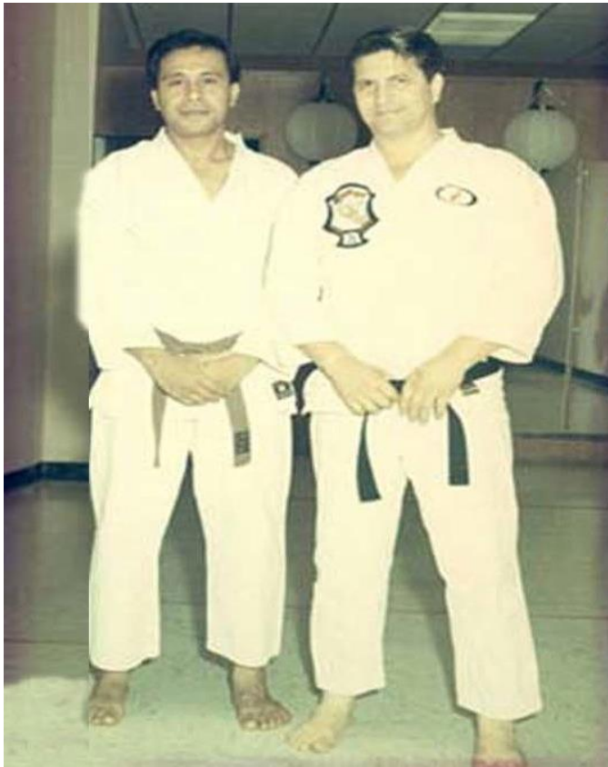
GM Tino Tuiolosega y GM Ed Parker

cuando problemas podrían ser arreglado con palabras de entendimiento. Tino creía firmemente que solo por medio del miedo el respeto sería alcanzado. Desafortunadamente, la misma filosofía vino a cobrarle factura años después cuando le causaría problemas con su familia y amigos.