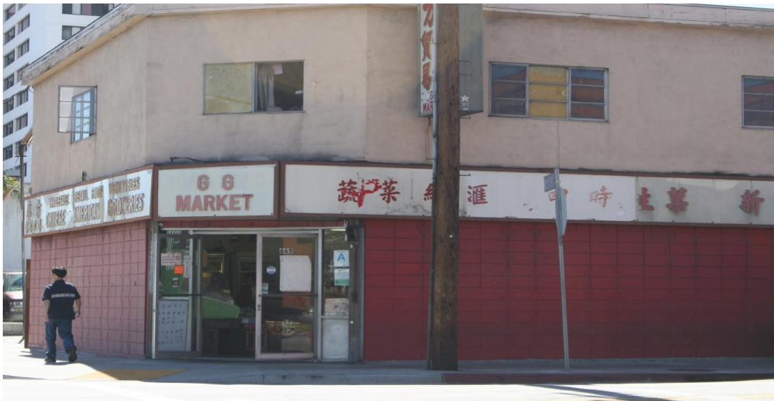
302 Ord St – entrada trasera a la escuela de .GM Wong.

Segundo piso de la escuela de Kung-Fu de Ark Wong en China Town Los Ángeles California